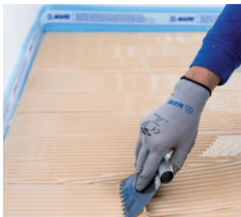
Facile à trueler