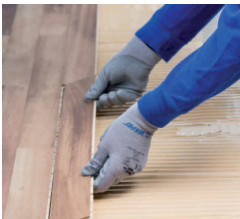
Pose de parquet